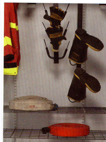
Shown with two hose racks, each rack sold separately.