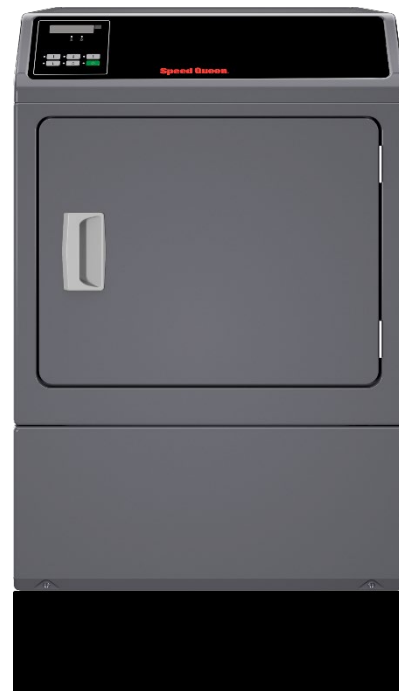
SD200 med sokkel