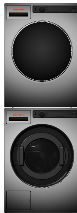
SC70 og DAM7 montert i søyle.